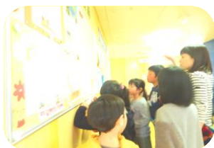
クイズの答えはなにかな？

2月24日に「入学おめでとう会」を開催しました。新一年生と小学生、中学生と高校生も参加して大変にぎわいました。オープニングステージは Affe!の皆さんによるサクソフォーンの演奏があり、みんなの知っている曲では手拍子をしたり、大人向けのクラシックの演奏のときはじっくり聴いてる場面があり、立派な一年生になると思いました。また、小学生と一緒に児童館クイズラリーも行い、小学生のみなさんも新一年生にヒントをあげたり一緒にクイズを探したりと頼もしい一面が見られました。中高生もプラバン工作や後片付けを自発的に手伝ってくれて成長を感じました。