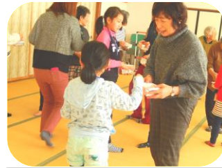
八幡館でじゃんけんぽん！