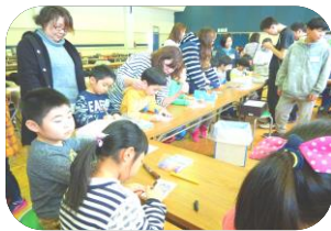
プラバン工作も上手にできた