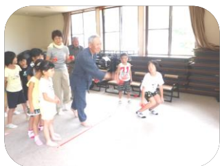
居土地区で トマトなげーむに挑戦