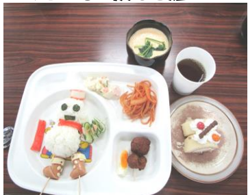
クリスマスメニューの完成!