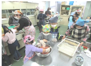
みんなでひき肉をこねるよ