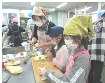
じゃがいもの皮むき難しい〜

おかわりの分はなかったのですが、美味しいご飯に大満足のように「もっと食べたい」「おかわり無いの?」という声もたくさん聞かれました。