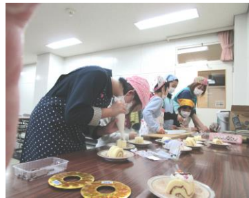
ロールケーキの飾りつけ、真剣だね