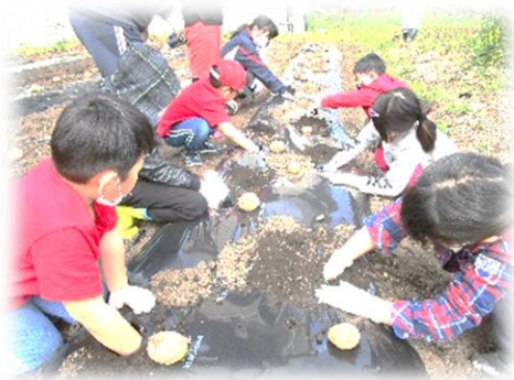
手首が隠れるくらいの穴を掘るよー

植えた花は福祉センターの玄関前に飾っています。子どもたちが毎日水やりなどのお世話をしているの、福祉センターに立ち寄る際はぜひご覧ください。