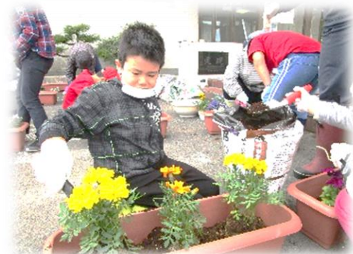
土をこぼさないように…そーっと…