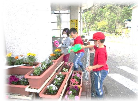
きれいで元気に育ちますように！