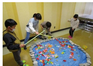
大物!伊勢えびをねらって!