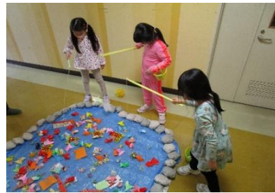
品定めをして、慎重に…慎重に…