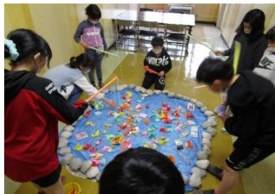
人気が殺到する物も!?