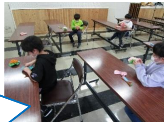
マイクを持って、ドキドキ自己紹介♡