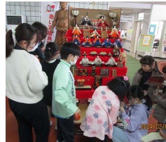
「あっ!! こわれた...」「そーとそーと 優しく」

女の子たちが、おひなさまの飾り付けをしてくれました。人形の表情や花嫁道具などにも興味津々! 「お金持ちの結婚式だな」「どうしてひなまつりの日は祝日じゃないのよ!」など、おもしろい会話も飛び交っていました。