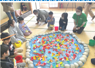
さかなつり名人がいる!!

新1年生のお祝いをするため、児童館に来ている在校生が遊びに必要な物を作ったり、あそびのコーナーの手伝いをしてくれたりしました。