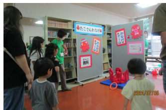
愛嬌たっぷり!見るだけでも楽しい、タコさん輪投げ