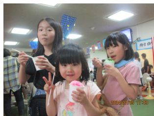
かき氷を食べた後は、舌の色の見せ合いで味調べ☆