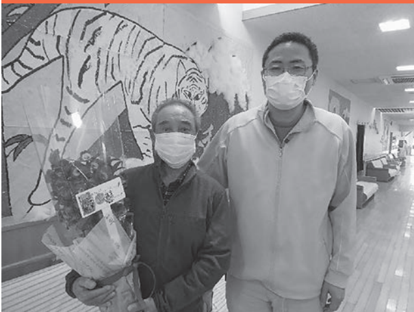
あずみ野デイセンターにて

赤い羽根共同募金の配分金をもとに行っている「ふれあいサロン」などの住民のみなさんの交流の機会が、新型コロナウイルスの影響で取りやめざるを得ない状況が続いております。そこで、赤い羽根共同募金にご協力いただいた介護施設等を対象に、雪深い冬にあっても生花の鑑賞を楽しんでいただこうと、お花の鉢植えを贈呈させていただきました。お礼のメッセージは放課後児童クラブに通う子どもたちが書いてくれました。 大鰐町社協では、町民の皆さまに、赤い羽根共同募金を社会の支え合いのしくみの一つとしてご理解いただけるよう、より目に見える形で還元できるような事業を考えて参りたいと思います。令和三年度もたくさんの方の善意をいただきましたことに、深く感謝申し上げます。