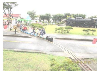
おでかけ児童館～交通公園