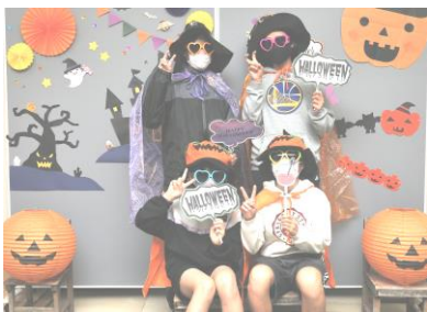
チャレンジクラブ～児童館ハロウィン