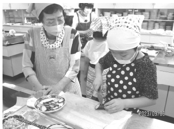
ふれあいクッキング