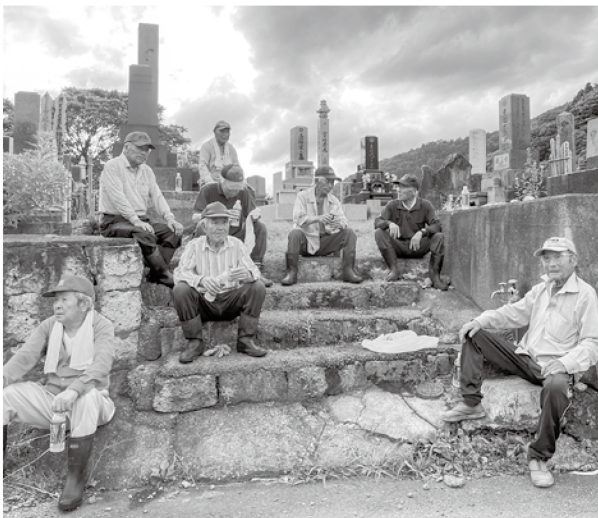
民生委員さんと「じっちゃんクラブ」のメンバー

会話のなかにさりげない地域住民への気づかいがあり、こんなつながりが元長峰地区を元気にする大きな力になっているのではないかと思います。