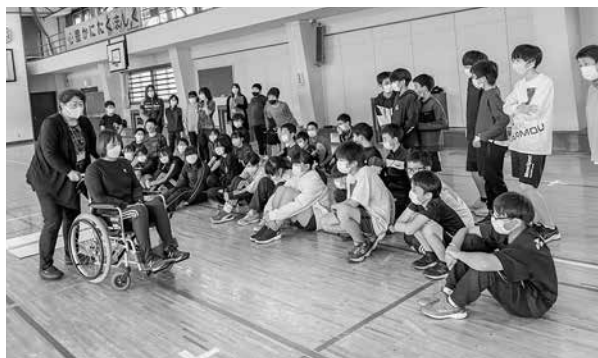
小学校でのボランティアスクールの様子