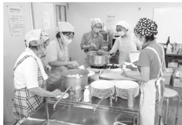
子どもたちのために、 愛情こめて作りました。