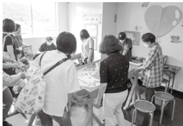
児童館まつりの 人気コーナーでお手伝い。