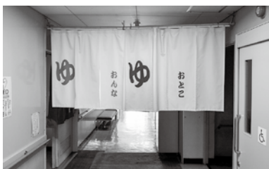
このれんがお風呂の目印です。