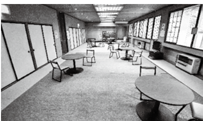
休憩室は落ち着いたカフェの雰囲気