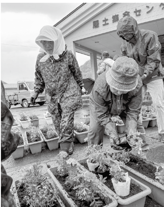
居土老人クラブの皆さん