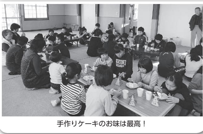
手作りケーキのお味は最高！

平成30年11月17日(土)、三ツ目内生活改善センターにおいて開催しました。クリスマスには少し早い時期でしたが、放課後子ども教室「めんちゃ教室」と「三ツ目内老人クラブ」をはじめ、地域のみなさんにご協力していただき、楽しいパーティーになりました。