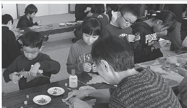
どんな飾り付けをするの？

「ボール送り」や「じゃんけん」でのゲームは年齢に関係無く、夢中になって大賑わいでした。また、ペーパーリー作りでは、びっくりするほど真剣に取り組んでいました。そして、最後はクリスマスらしく、手作りケーキをおいしく食べました。