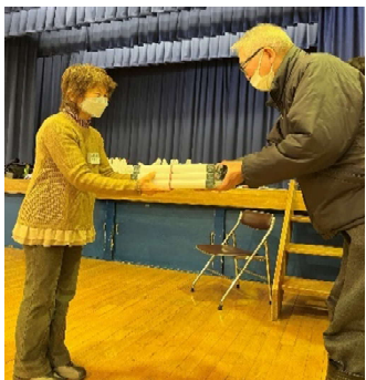
優勝チームの九十九森Bチーム

競技中は、あちこちで拍手や歓声が上がりに盛り上がりしていました。今年初めて参加した単老もあり、参加者からは、「楽しかった」「是非、自分たちの単老でもやりたい」などの声が聞かれました。